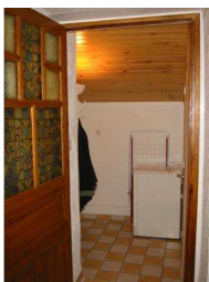
Vestiaire & wc avec lave-linge