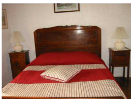
Chambre 1 Lit 140