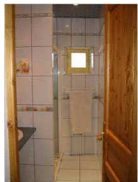
Salle d'eau douche spacieuse