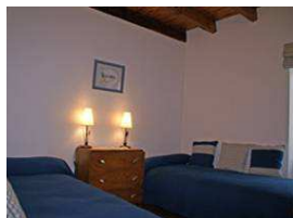
Chambre 2 lits 90