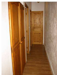
Couloir avec penderie